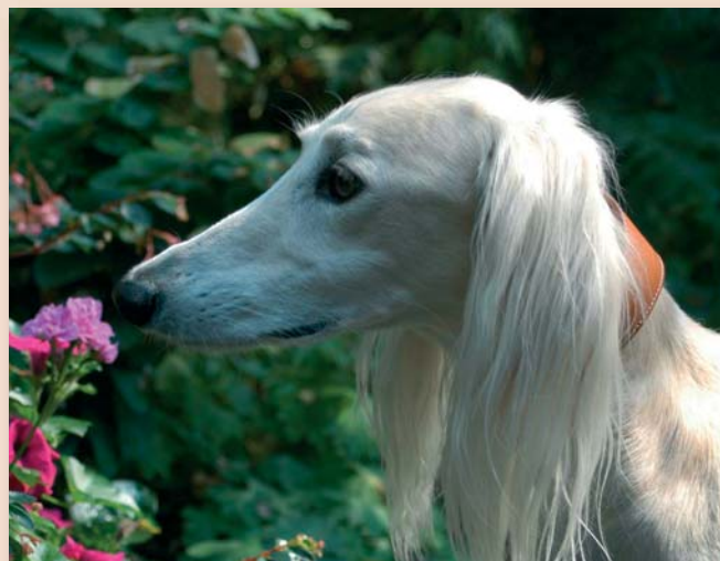
Een uniforme certificering binnen de rashondenfokkerij is volstrekt uniek in Nederland.

Zowel de Raad van Beheer als de rasverenigingen moeten de achterban blijven informeren. De Raad stelt regelmatig een gratis nieuwsbrief – "Rasecht" – beschikbaar, waarin de vorderingen van certificering op de voet worden gevolgd en waarin de meest gestelde vragen worden beantwoord. Rasverenigingen kunnen deze teksten en de teksten die nog gaan verschijnen in de kynologische bladen, op hun websites en in hun clubbladen publiceren.