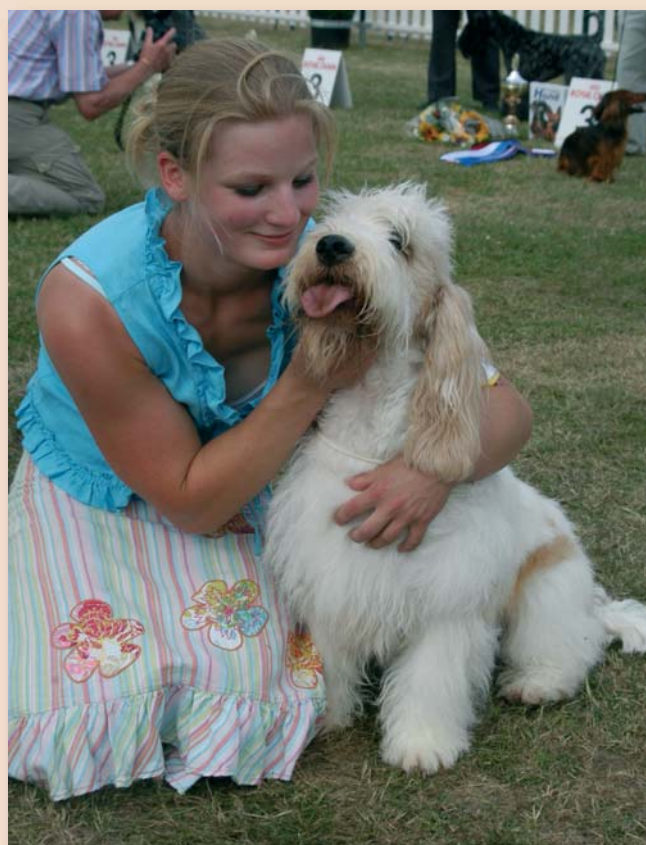
Certificering is een grote stap voorwaarts in de rashondenfokkerij.

Behalve de website van de Raad van Beheer – www.raadvanbeheer.nl – geeft ook de nieuwsbrief van de Commissie – "Rasecht" – regelmatig de laatste stand van zaken weer. U kunt zich inschrijven via de website www.raadvanbeheer.nl . Abonnementen op "Rasecht" zijn gratis.