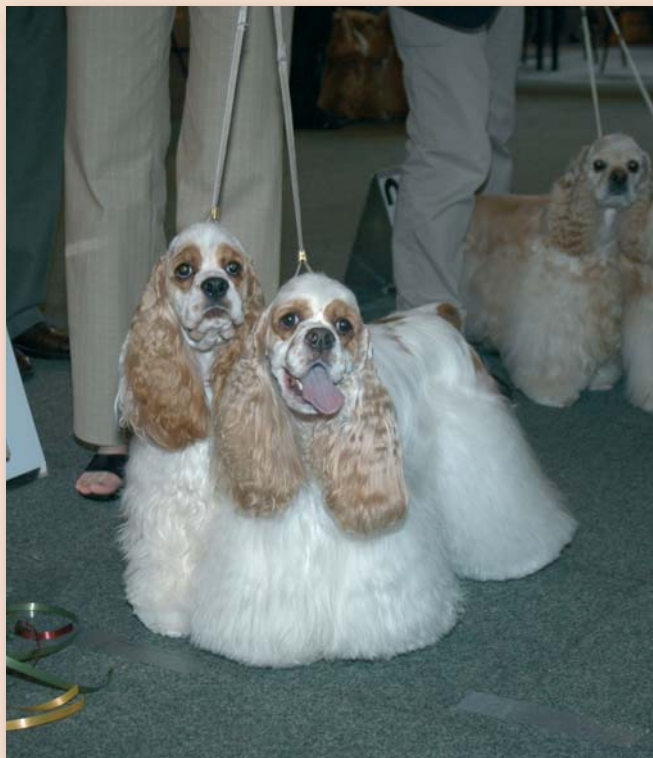
Rasverenigingen kunnen de fokisen met betrekking tot kwalificaties op tentoonstellingen zelf bepalen.

ren, aan de hand van datzelfde logo, dat de fokker aan de verplichte voorwaarden heeft voldaan en dus serieus met zijn of haar ras bezig is. Zij zien ook dat de noodzakelijke gezondheidsonderzoeken zijn gedaan, dat de desbetreffende fokker op het welzijn van zijn honden let, de huisvesting op orde heeft en voldoende kennis bezit om verstandig te fokken. Daarna is één muisklik voldoende om bij het ras en/of de fokker van hun keuze terecht te komen.