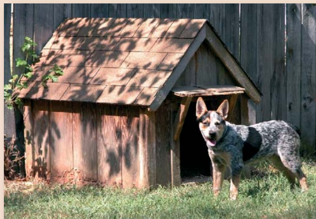
Gecertificeerde fokkers moeten ook aan de eisen met betrekking tot huisvesting en socialisatie voldoen.

Het signaleren – voor of na de geboorte - van een nest dat niet aan de voorwaarden van het fokreglement voldoet, is niets nieuws en valt onder de bevoegdheden en de taken van het bestuur van de rasvereniging. Veel rasverenigingen houden nu ook al in de gaten of hun fokkers voor puppbemiddeling etc. in aanmerking komen en/of de adviezen van een Fokadvies Commissie of van een Fokkerijcommissie zijn opgevolgd.