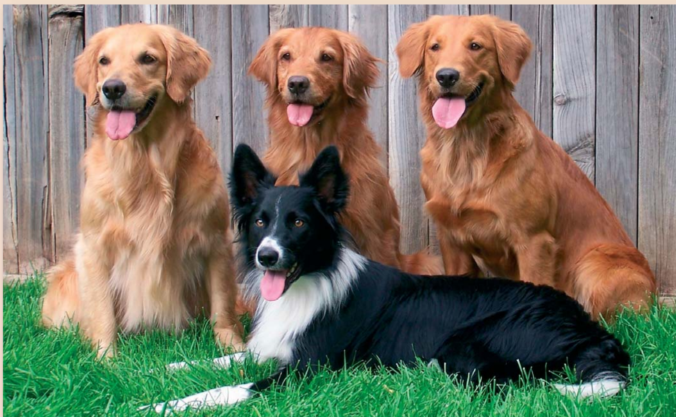
Een fokker die meer van één ras fokt, kan voor certificering in aanmerking komen, mits hij/zij zich voor alle rassen kwalificeert als een gecertificeerde fokker.

aal ontwikkeld, dat is toegespitst op de dagelijkse praktijk van het fokken van rashonden. In tekst en foto's wordt de cursist aan de hand genomen vanaf het besluit om een nest te gaan fokken tot en met het moment dat de pups naar hun nieuwe eigenaren gaan. Bedoelde fokkers moeten aan deze laagdrempelige opleiding met succes hebben deelgenomen voordat men voor certificering in aanmerking komt. Kynologen clubs, rasverenigingen en rasgroepen kunnen een grote rol spelen bij deze kennisoverdracht.