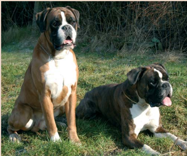
De serieuze fokkers van rashonden krijgen het voetstuk waarop ze behoren te staan.

Rasverenigingen zijn vrij om ten aanzien van de bovenstaande regels zwaardere eisen te stellen. Lichtere eisen dan de bovenstaande zijn niet toegestaan.