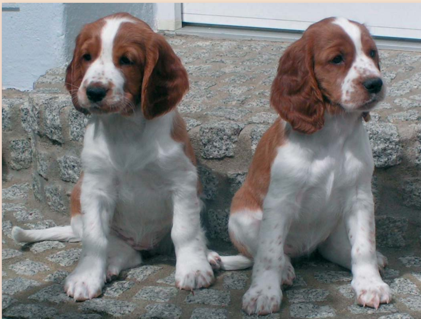
Voor de kopers van pups zijn de gecertificeerde rasverenigingen en de gecertificeerde fokkers direct herkenbaar, transparant en controleerbaar.

Er is maar één antwoord mogelijk: bij de gecertificeerde rashondenfokker. Behalve dat zij herkenbaar worden aan