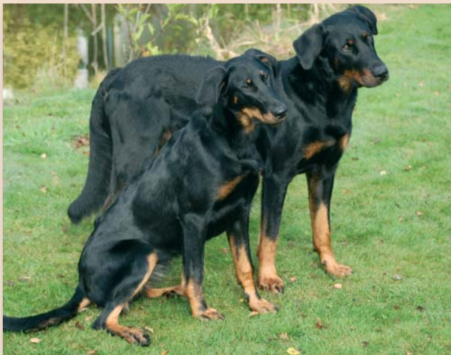
De zorgvuldig gefokte rashond verdient een eigen, direct herkenbaar platform.

Belangrijk: rasverenigingen kunnen in het RFR nog andere, op het ras toegespitste eisen opnemen, mits deze niet conflicterend zijn met de verplichte artikelen.