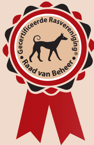
Logo gecertificeerde rasvereniging

Deze brochure – Certificering van rasverenigingen en rashondenfokkers – wordt u aangeboden door de Raad van Beheer op Kynologisch Gebied in Nederland. De Raad van Beheer is hét aanspreekpunt als het gaat om rashonden, om kynologische informatie en ondersteuning in de ruimste zin van het woord. Het werkterrein van de Raad van Beheer is heel breed: van stamboomregistratie, hondenopvoeding, hondensport en –tentoonstellingen naar gedrag, gezondheid en welzijn van honden.