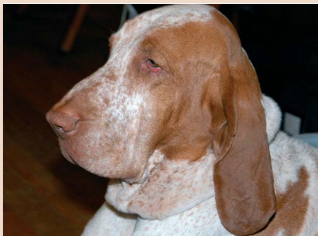
Bij rashondenfokkers die gecertificeerd willen worden, moet de huisvesting op orde zijn.

Zie verder onder het kopje De toekomst .