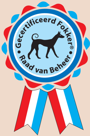
Logo gecertificeerde fokker